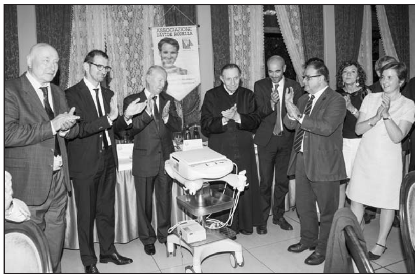
Il momento della consegna delle apparecchiature all’Ospedale di Montichiari.

La parte ufficiale della serata, la presentazione del bilancio relativo al 2013, è stata affrontata dal