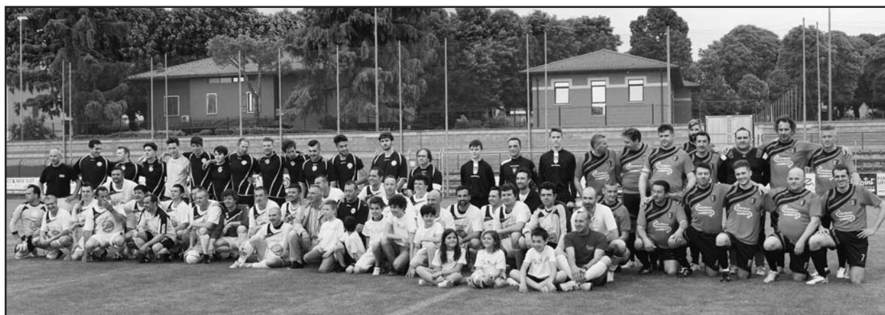
I partecipanti alla manifestazione presso lo Stadio Romeo Menti.